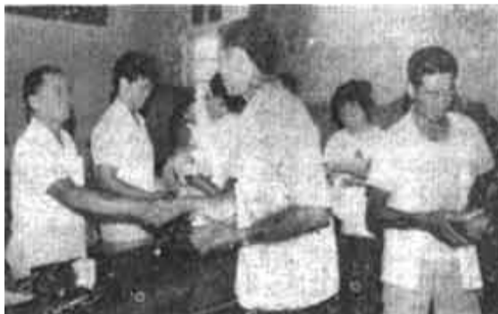
河口区保险公司及时为义和镇9个棉田投保村办理雹灾保险兑现手续，为农民抗灾自救恢复生产提供资金援助。