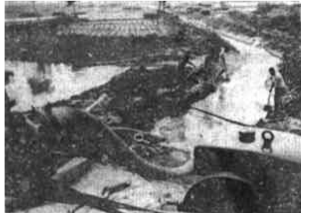
东营区油郭乡调集20余台机械昼夜抽水，使成灾面积迅速下降。