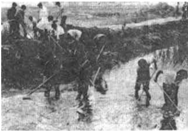
灾。 ▲垦利县派出基干民兵及时投入抗