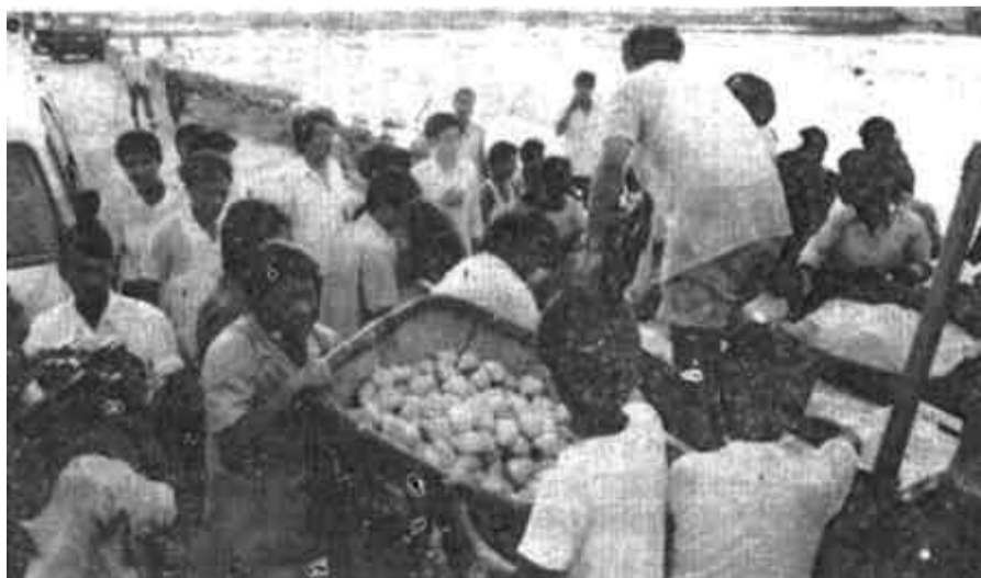
后困 ▲由于连降暴雨，河口区有5个村庄被积水围困，群众饮水吃饭成燃眉之急。区委区政府领导得知后立即组织有关部门加工馒头、点心送给群众。