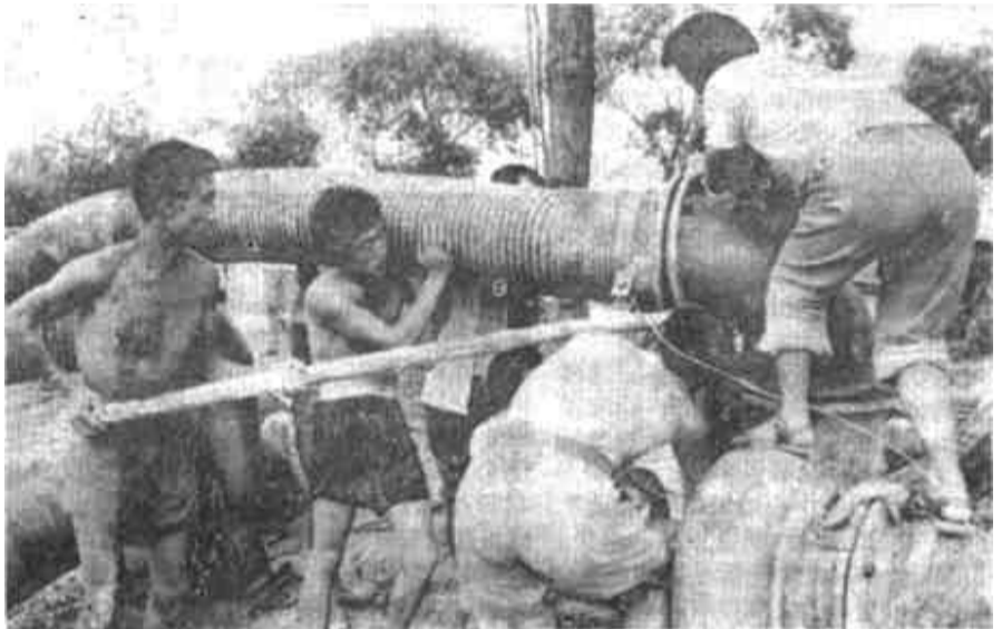
▲利津县盐窝镇在自然排水困难的情况下，及时组织群众安装抽水设备，抽水排涝。图为农民们在冒雨安装水泵。