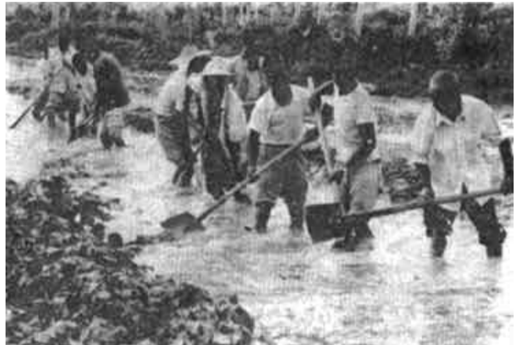
垦利县郝家乡发动全乡男女老少齐上阵，开沟挖渠，排涝救灾。目前该乡36000亩农田里的明水已基本排除。