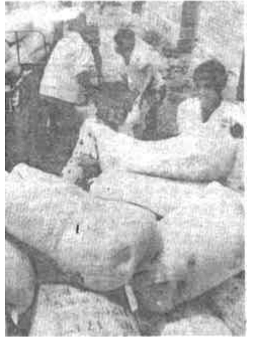
东营区史口乡遭受涝灾后，立即组织力量，从全省各地调拨化肥1000吨，支援农民恢复生产。